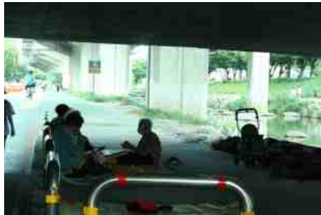
공깃돌이 구를 때 나는 소리

돌무더기의 정체는 바로 공깃돌이었다. 다행히도 공기를 못하는 건 아니었던 터라 쉽게 그 돛자리 한편을 내어 받을 수 있었다.